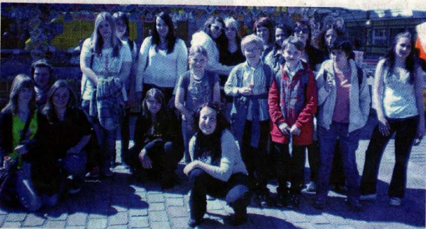
Die deutsch-tschechische Gruppe der Further Realschule in Pilsen