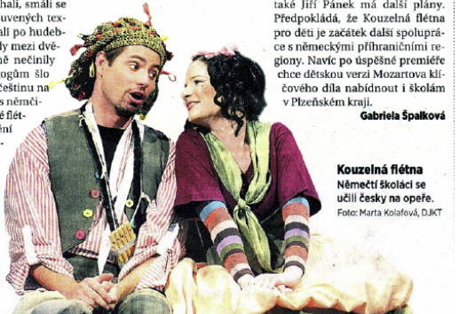
Kouzelná flétna Němečtí školáci se učili česky na opeře.